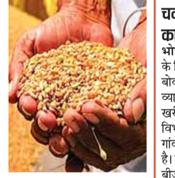
सरकारी केंद्रों पर फ्री में होगा पंजीयन

किसानों के लिए सहकारी समितियों के केंद्रों पर पंजीयन फ्री रहेगा, जबकि एमपी ऑनलाइन, कॉमन सर्विस सेंटर और लोकसेवा केंद्रों पर 50 रुपए देकर पंजीयन कराया जा सकता है। पंजीयन के लिए किसान का नाम, आधार नंबर, बैंक खाता विवरण, आधार से लिंक मोबाइल नंबर और समग्र आईडी का होना जरूरी है। साथ ही किसान विक्रय हेतु नॉर्मिनी भी नियुक्त कर सकते हैं जिसके लिए नॉर्मिनी का आधार देना होगा। सत्यापन की प्रक्रिया बायोमेट्रिक या ओटीपी से पूरी की जाएगी।