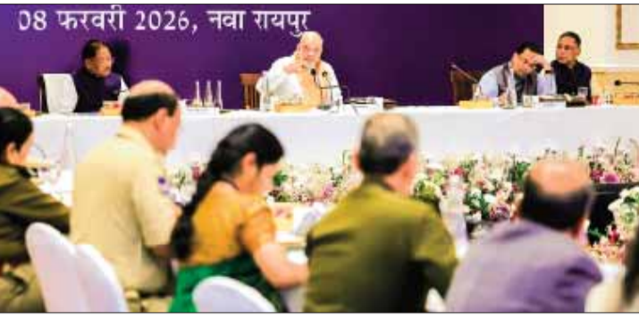
अधिकारियों के साथ रायपुर में नक्सलवाद के खत्म के लिए केंद्रीय गृहमंत्री अमित शाह की बैठक

नक्सल प्रभावित राज्यों के डीजीपी भी शामिल 08 फरवरी 2026, नवा रायपुर