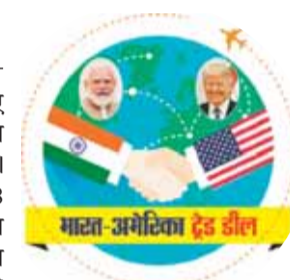
भारत-अमेरिका ट्रेड डील

भारत और अमेरिका के बीच हुए नए व्यापार समझौते ने भारतीय वस्त्र उद्योग के लिए बड़ा जरवाजा खोल दिया है। इस समझौते के बाद अमेरिका का 118 अरब डॉलर का आयात बाजार भारतीय कपड़ा और परिधान क्षेत्र के लिए ज्यादा सुलभ हो जाएगा। सरकार ने इसे निर्यात, निवेश और रोजगार बढ़ाने की दिशा में अहम कदम बताया है। अमेरिका पहले से ही भारत के वस्त्र निर्यात का सबसे बड़ा बाजार माना जाता है। वस्त्र मंत्रालय ने कहा कि इस समझौते से भारतीय वस्त्र और परिधान उत्पादों पर लगने वाला 18 प्रतिशत जवाबी शुल्क घटेगा। इससे भारतीय निर्यातकों को कीमत के मामले में सीधा फायदा मिलेगा। मंत्रालय का कहना है कि अब भारत की स्थिति बांग्लादेश, चीन, पाकिस्तान और वियतनाम जैसे प्रतिस्पर्धी देशों की तुलना में मजबूत होगी। बड़े अंतरराष्ट्रीय खरीदार भी अब अपनी खरीद रणनीति में भारत को प्राथमिकता दे सकते हैं।