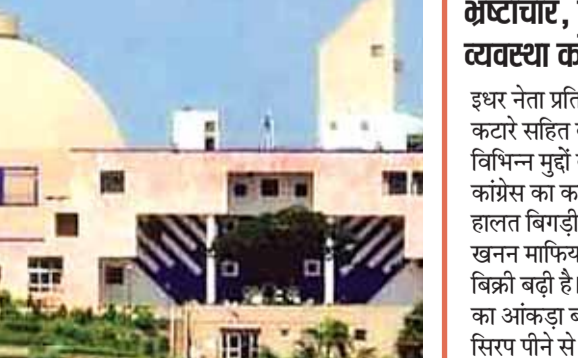
कांग्रेस की तैयारी, सरकार हर जवाब के लिए तैयार

इसी माह होने जा रहे बजट सत्र को लेकर विधानसभा में व्यापक तैयारियां शुरू हो गई हैं। इस बार विधायकों ने ऑफलाइन से ज्यादा ऑनलाइन सवाल किए हैं। विधायकों ने कुल 2253 ऑनलाइन सवाल किए हैं। वहीं विपक्षी दल कांग्रेस ने इस बार बिगड़ती कानून व्यवस्था, बढ़ते भ्रष्टाचार, इंदौर में दूषित पानी, छिंदवाड़ा में जहरीले कफ सिरप से मौतों को लेकर सरकार को घेरने की तैयारी की है। विधानसभा में विधायकों को ऑनलाइन सवाल करने, ध्यानाकर्षण प्रस्ताव शून्यकाल की सूचनाएं ऑनलाइन भेजने की सुविधा प्रदान की गई है। इस बार भी सवाल भेजने का समय समाप्त हो गया है। अब तक कुल 3 हजार 478 सवाल विधायकों ने विभिन्न विषयों पर पूछे हैं। इसमें 2 हजार 253 ऑनलाइन सवाल पूछे गए हैं और ऑफलाइन सवाल 1 हजार 225 पूछे गए हैं। इनमें एक हजार 750 तार्यांकित और 1728 सवाल अतार्यांकित आए हैं। ध्यानाकर्षण प्रस्ताव भेजने के लिए अभी समय बाकी है। शून्यकाल की सूचनाएं, नियम 139 के तहत प्रस्ताव, याचिकाएं, भेजने के लिए अभी समय बाकी है।