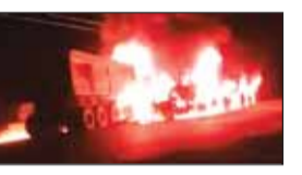
आग लगते ही मौके पर मची भगवद इसी दौरान पीछे से आ रहे एक और ट्रेलर ने भी टक्कर मार दी। टक्कर के तुरंत बाद तीनों ट्रेलरों में भीषण आग लग गई। आग लगते ही मौके पर हड़कंप मच गया। एक ट्रेलर में एक व्यक्ति फंस गया था, जिसे बाहर निकाला गया, लेकिन तब तक उसकी मौत हो चुकी थी।

जांजगीर-चांपा। अकलतरा थाना क्षेत्र के कोटवाड़ गांव में भीषण सड़क हादसे में कोयले से भरे तीन ट्रेलरों में आग लग गई, जिससे इलाके में अफरातफरी मच गई। हादसे में एक व्यक्ति की मौत हो गई, जबकि दो लोग गंभीर रूप से घायल हो गए, जिन्हें अकलतरा अस्पताल में भर्ती कराया गया है। प्राप्त जानकारी के अनुसार, एक ट्रेलर अकलतरा से बलौदा की ओर जा रहा था। विपरीत दिशा से आ रहे दूसरे ट्रेलर से उसकी आमने-सामने टक्कर हो गई।