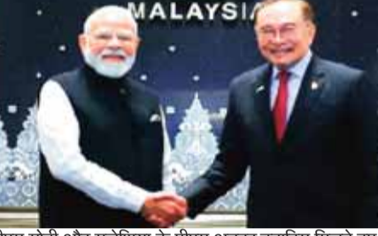
पीएम मोदी और मलेशिया के पीएम अनवर इब्राहिम मिलते हुए

दोनों देशों के बीच ये हुए एमओयू सुरक्षा, स्वास्थ्य और चिकित्सा क्षेत्र, व्यावसायिक शिक्षा एवं प्रशिक्षण (टीवीईटी) में सहयोग, ऑडियो-विजुअल सह-निर्माण समझौता, आपदा प्रबंधन में सहयोग, भ्रष्टाचार से निपटने और उसे रोकने में सहयोग, संयुक्त राष्ट्र शांतिरक्षा सहयोग पर समझौता ज्ञापन पर पत्र का आदान-प्रदान, सेमीकंडक्टर क्षेत्र में सहयोग, अंतर्राष्ट्रीय बिग कैट्स एलायंस (आईबीसीए) पर डांचागत समझौता, कर्मचारी राज्य बीमा निगम (ईएसआईसी), भारत गणराज्य और सामाजिक सुरक्षा संगठन (पीईआरकेईएसओ) मलेशिया के बीच में बीमित व्यक्तियों के रूप में भारतीय नागरिकों के लिए सामाजिक सुरक्षा कार्यक्रमों और गतिविधियों पर