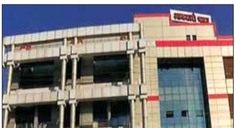
आग लगने का कारण फिलहाल स्पष्ट नहीं

राजधानी रायपुर के लामांडी इलाके में स्थित आबकारी भवन में शनिवार रैत अचानक आग लगने से हड़कंप मच गया। आग भवन की तीसरी मंजिल पर लगी, जहां आबकारी निगम का एक महत्वपूर्ण कार्यालय संचालित होता है। इस हादसे में विभाग की कई अहम फाइलें और दस्तावेज जलकर नष्ट होने की सूचना है। बताया जा रहा है कि जिस अनुभाग में आग लगी, वहीं सोमवार से निगम के अत्यव्यय से जुड़ा ऑडिट प्रस्तावित था।